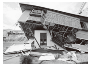
例 耐震シェルター