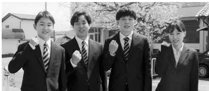
今年度採用の新規職員たち

日高町のために働きたい人、日高町のまちづくりに参加したい人、ぜひご応募ください。