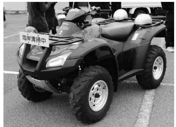
ホンダビーチクリーナー