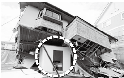
耐震シェルターの一例