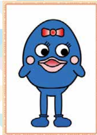
く - こ クーコ ちゃん (◇歳)

どこからも見てクエだよね!天然で悠々自適。いつもみんなを笑顔にしてくれてありがとう♥