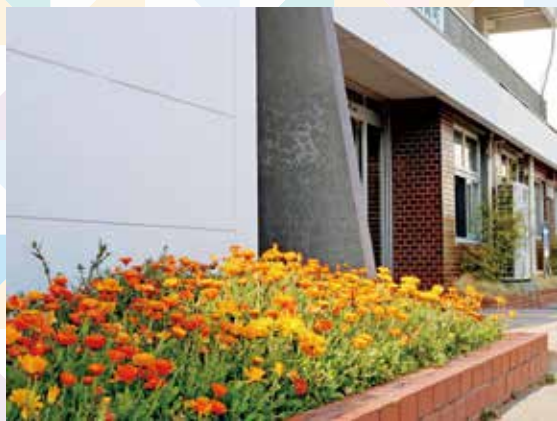
昨年11月に中央公民館前に職員が植えたキンセンカも、美しい花を咲かせました。

忙しくて時間がなかった...。外出を自粛した...。行きたかったけどお花見に行けなかった、そんな皆さんに、きれいな桜をおすそ分け。