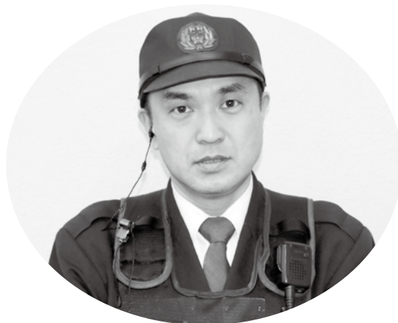
高家警察官駐在所勤務