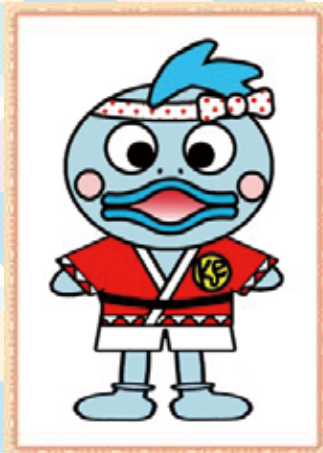
く え た ろ う クエ太郎 くん (△歳)