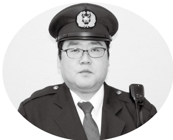
比井警察官駐在所勤務