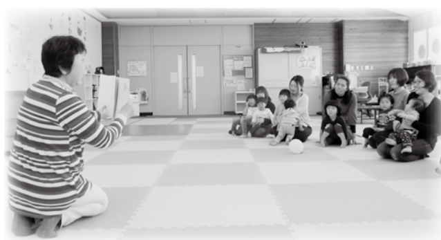
絵本・紙芝居楽しかったね♪

※ 0～3歳の未就園児とその保護者の方が、対象となっています。 ※ 月～金 午前 9:00～12:00 午後 13:00～16:00 お問い合わせは、子育て支援センター (☎70・4140)まで。 (保健福祉総合センター内)