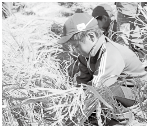
懸命に稲を刈る様子(内原小)

収穫したのはもち米で約100kgの収量が見込めるそう。12月にはこのお米を利用して餅つきを行う予定です。