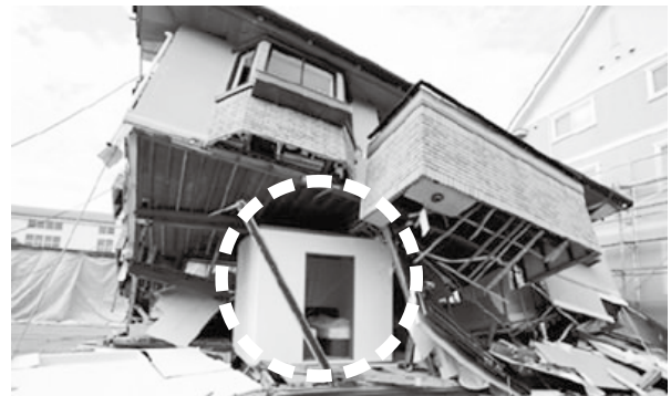
耐震シェルターの一例