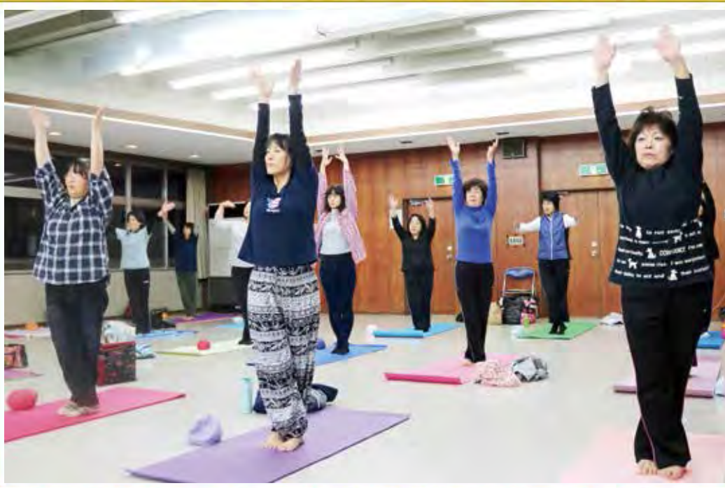
体ゆがみ治し体操教室