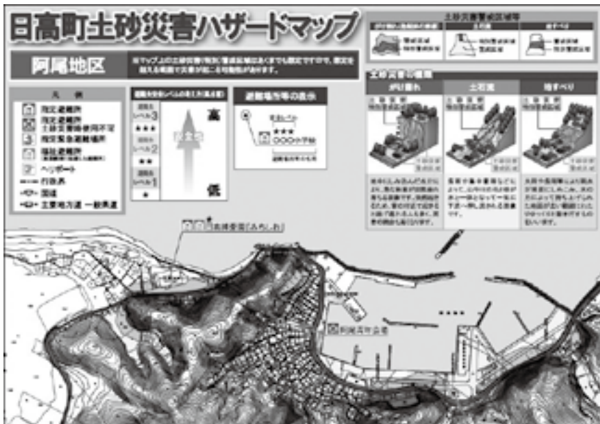
土砂災害ハザードマップ(阿尾地区の一部を抜粋)

土砂災害特別警戒区域に指定された区域は、土砂災害が発生した場合に建築物に損壊が生じ、住民の生命・身体に著しい危険が生じるおそれがあります。