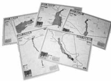
ため池ハザードマップ(イメージ)

また、農村地域防災減災事業により、町内9箇所のため池について浸水被害区域を想定する、ため池ハザードマップを作成いたします。