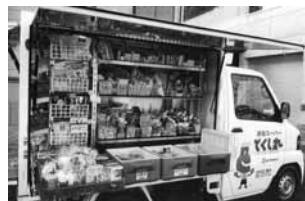
株松源による移動スーパー(上) 紀州農協による移動スーパー(下)