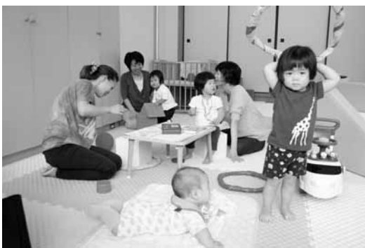
「クエッコランド」の様子

次に、福祉施策につきましては、平成26年度に策定いたしました「地域福祉計画」のつながり・支え合いが交わりながら結びつく温かい地域 ひだかを基本理念とし、一人ひとりの住民が安心