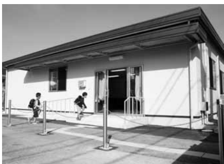
平成27年度に完成した 志賀学童保育所

また、保育所の利用料につきましては、これまで「日高町第三子以降に係る保育料無料化事業」として、3人目のお子様については、これまで0歳から2歳児までを無料としてまいりましたが、平成28年度より、対象年齢