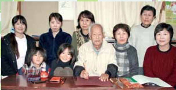
「書く楽しみを一緒に体験しませんか？」