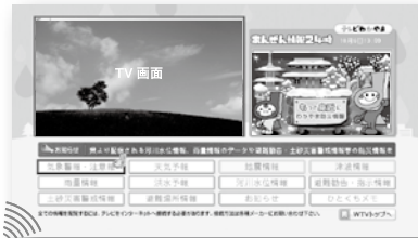
※テレビ和歌山の場合

地デジ対応テレビのリモコンのdボタンを押し、防災情報の項目を選択すると、ほぼリアルタイムの防災情報を見ることができます。