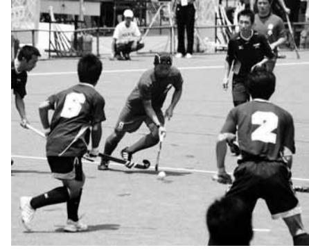
昨年秋のプレ大会 (ホッケー競技)

な連携のもと、町民一丸となつて英知と情熱を結集した大会実現を目指します。また、全国からお越しになるみなさまを「おもてなしの心」でお迎えし、大会に参加するすべての人が躍動し、歓喜し、交流と絆が深まる大会運営に努めてまいります。 生涯学習につきましては、自己の向上や充実を目指すため、学校教育だけでなく公民館教