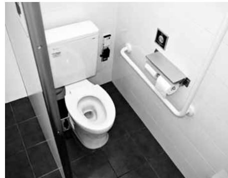
便座が洋式になりました