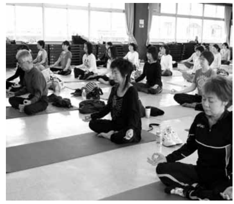
公民館教室(美肌ヨガ教室)

室・スポーツ・文化・自然体験等あらゆる分野で生涯にわたって行われる学習活動を推進してまいります。