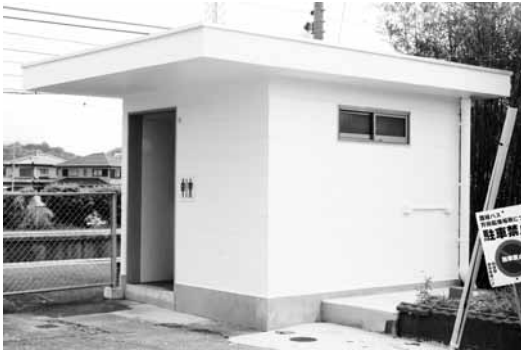
改修が完了した紀伊内原駅のトイレ

今後は、駅舎および駅舎周辺を総合的に整備計画する駅舎活用基本計画を基に、駅舎の無償