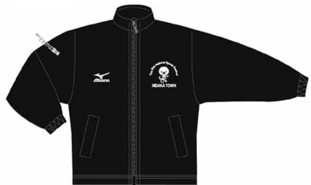
※ウインドブレーカー(見本)