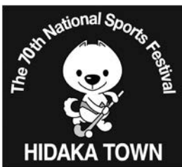
左胸のホッケーきいちゃん

この度、日高町実行委員会では、第1弾としてオリジナルウインドブレーカーを作成し販売を始めます。