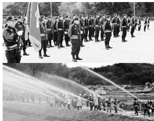
昨年の出初式の様子