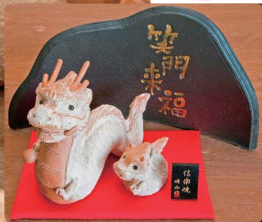
迎春・干支(辰)の置物(信楽焼・明山窯)