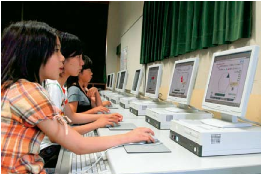
難しいが楽しいな

当委員会は、去る5月28日、防災対策・コンピュータ教育などについて、内原小学校、日高中学校を視察した。 まず、内原小学校で、6年生のコンピュータを使った授業を視察、小学校での教育目的は、コンピュータに慣れ親しむためのものであり、2年生は週1回、3年生以上は週2回実施しているとのことであった。 また、中学校では、イ