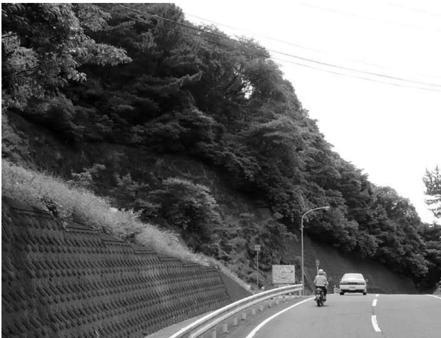
大変暗い小坂峠 照明の改善が必要

町長 防犯灯から歩道まで距離があり、十分な照度となっていない状況である。限られた予算ではあるが増設を検討したい。