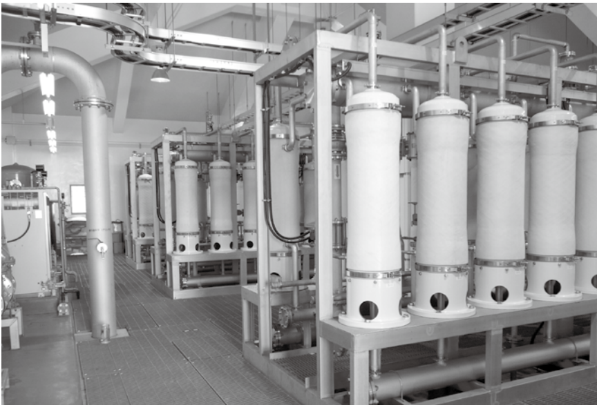
ろ過装置UF膜（萩原浄水場）

町長 5年の耐用年数の中で、今回の件で会社と交渉の結果、3年半分は町負担、1年半分は会社負担となった。