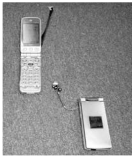
使用方法が問われる携帯電話