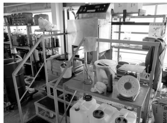
廃天ぷら油が軽油に生まれ変わります

問 家庭から出る廃天ぷら油は平均年間4リットルと言われているが、ほとんどは、新聞紙に染みこませたり、固めたりしてゴミとして処理されている。