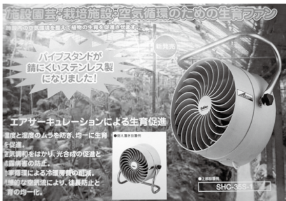
ハウス内に設置予定の循環ファン