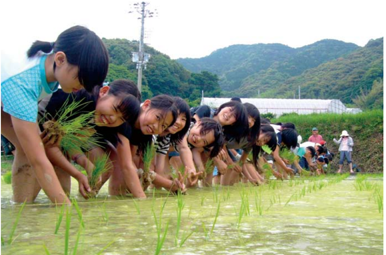
秋にはおもちだ！（内原小学校6年生）