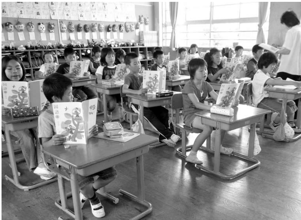
授業風景（内原小学校）

問 来年度から新しい学習指導要領の移行期間となり、小学校5、6年生に英語活動を週1時間おこなうこととなっている。日高町ではすでに小学校3年生から英語活動がおこなわれているが、経