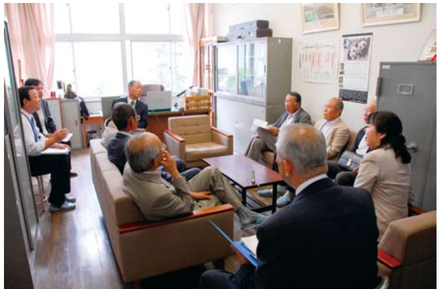
倒れ止めなどの処置が必要だ

一方、防災対策については、各学校において、対策マニュアルはできているが、これに添った訓練を重ね、体感させることが最も重要である。 本年度より、各学校に地震速報サービスが導入されるが、地震時におけるロッカーなどの固定の不備が見られた。