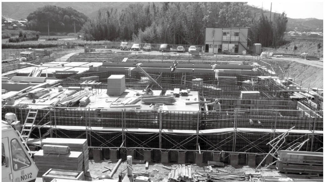
内原東下水処理場（20年2月末完成予定）

企画財政課長 内原東地区下水処理場の西隣りに公園整備をするもので、整備面積は1209㎡、公園中央に水を基調とした池を作り、散策道路、植栽、複合遊具等を設置する。事業費3千万円の計画である。