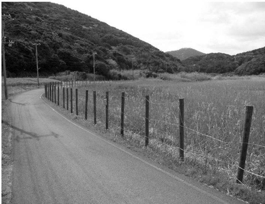
県道の改良は悲願（阿尾不毛地内）

問 県内でも有数の湿地帯として、動植物の宝庫となっている阿尾不毛の造成計画について。