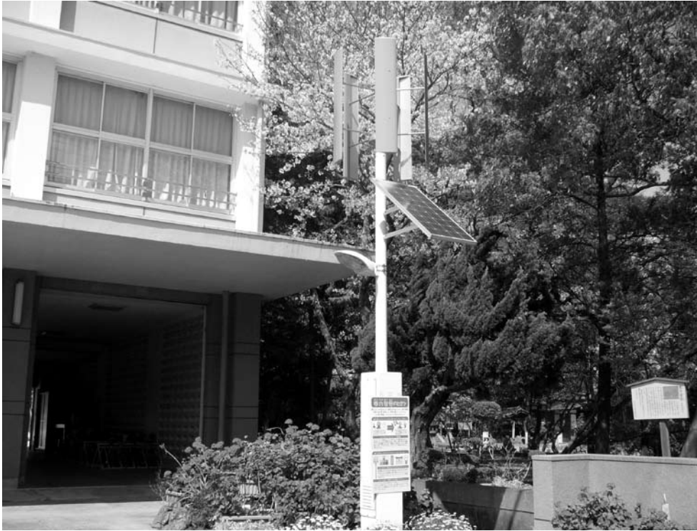
風力と太陽光を利用した小型発電装置（由良小学校）