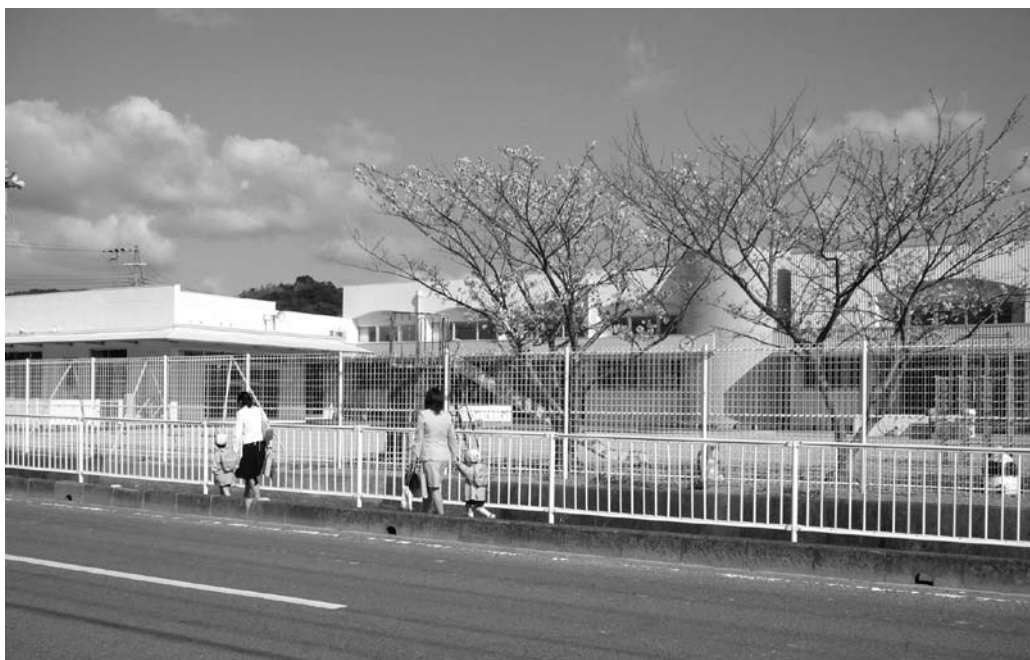
派遣会社から臨時保育士が派遣される

問 派遣会社が保育士、バス運転手を募集していたが、町内からは何名雇用されているか。 住民福祉課長 臨時保育士について