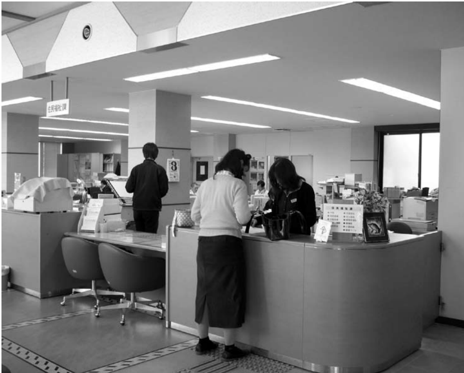
機構改革で住民サービスの向上を

問 機構改革の目的と目標は。 町長 行財政改革の一環として、組織のスリム化効率化により、多様化する住民ニーズに迅速かつ的確に対応し、住民サービスの向上、地域の活性化につなげたい。