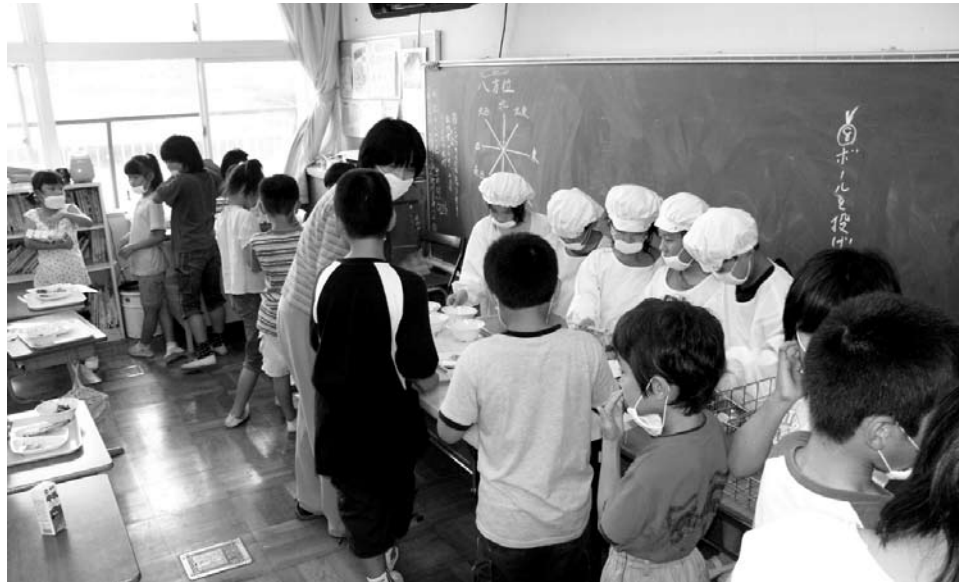
早くも2年 学校給食

問 給食が実施されて2年以上が経過した。全国的に滞納が大問題になっているが、当町は大丈夫か。 教育長 滞納ではないが、口座振替で徴収する分、残高不足による引落不能が毎月数名いる。