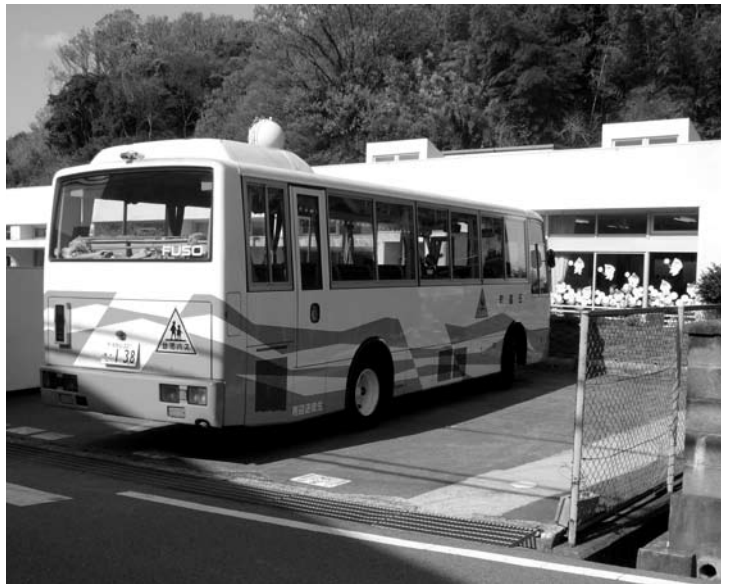
バスの運行管理を人材派遣会社へ委託

問 税源移譲によって住 民税が昨年度の2400 人に加えて、新たに62 7人が課税対象となる。 連動して介護保険料額 値上りの影響を受ける 人数は。 住民福祉課長 介護保険