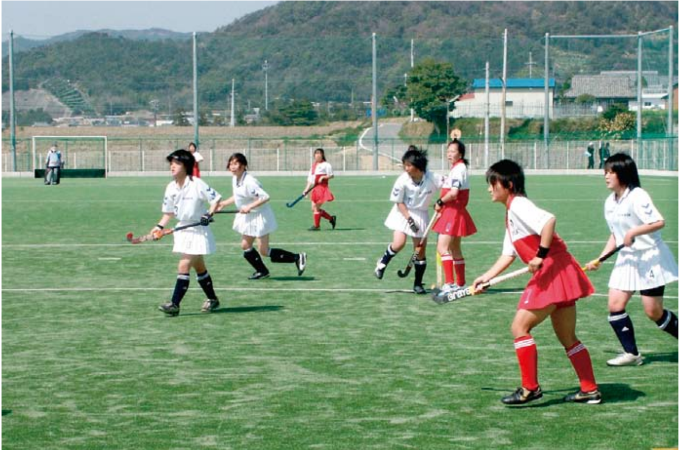
日高町で初の全国高校ホッケー大会（マツゲングランド） 紀央館高校 対 ひわき 樋脇高校（鹿児島県）