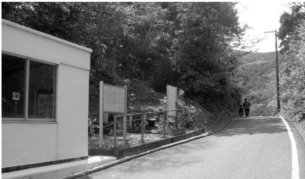
見通しが悪く狭い県道（田杭地内）

り、造成をおこない、直線、歩道付き2車線、延長400mの県道で整備を計画している。