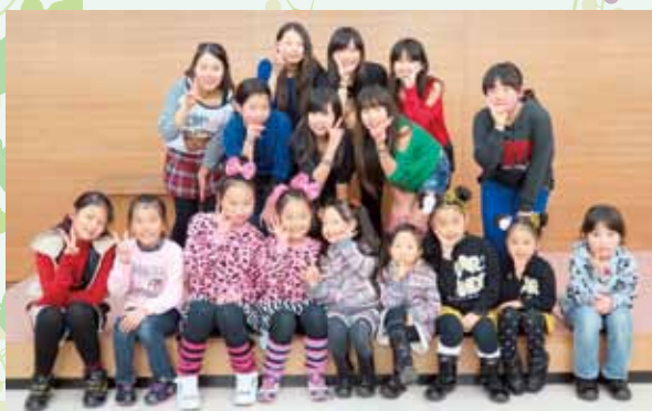
「興味のある方は いつでも 遊びに来てくださいね！」