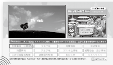
※テレビ和歌山の場合

地デジ対応テレビのリモコンの dボタン を押し、防災情報の項目を選択すると、ほぼリアルタイムの防災情報を見ることができます。